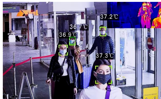
Fotó: Temperature-scanning technology and thermal imaging at an airport terminal.

A várakozás alatt szembetűnő a gyakoribb ellenőrzés, mind a maszk megfelelő használatát, mind a távolságtartást illetően. Ezen felül több helyen is van kamerás testhőmérsékletmérés. Rómában például 6 különböző ponton és formában mérik a testhőmérsékletet: a teljes alakos hőkamerás ajtókon kívül a csuklón vagy a homlokon is ellenőrzik a testhőmérsékletet.